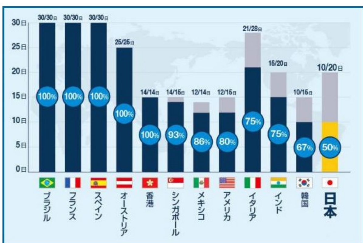
各国の有給休暇の取得率

次いで消化率が低かったのは韓国（67%）。以下、インド・イタリア（ともに75%）、アメリカ（80%）、メキシコ（86%）と続いた。一方、ブラジル・フランス・スペイン・オーストリア・香港の取得率は100%だった。