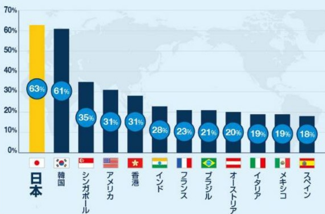
有給休暇の取得時に罪悪感を感じる人の割合

また、休みを取る際に「長期間休みづらい」と考え、短い休暇を複数回取る人の割合も日本は49%で最多。また「休暇中も仕事のメールを1日中見てしまう」という日本人の割合も22%でトップだった。